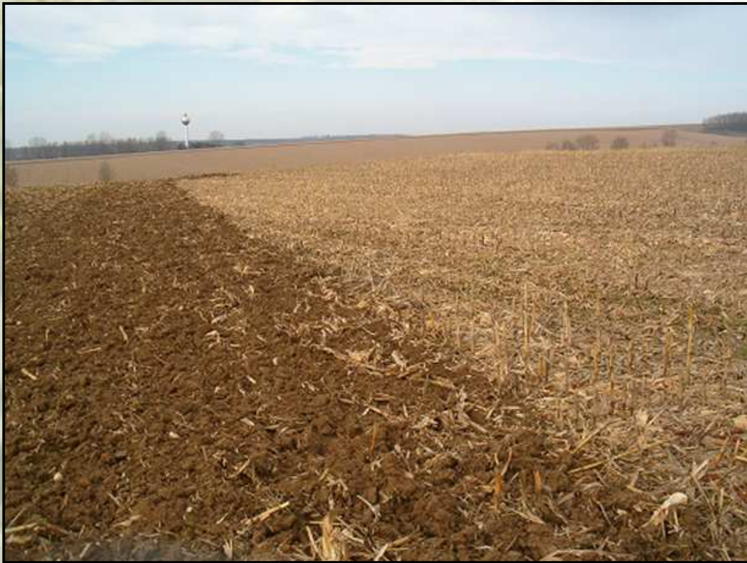
Duolent DX 460 NS – Challenger MT665B kukorica tarlón 12-15 cm művelési mélység, 7 t termésátlag (Böhönye, Feketesár Zrt.)

A Nagybjajomi Mg. Zrt. területén, Nagybjajomban egy RÁBA Steiger traktorral üzemeltettük a Duolent DX 460-at. A gép a szecsázott kukorica tarlóban kiváló munkát végzett. Az eredmény: kedvező rögfrakció, morzsás talajszerkezet, a szármaradványok döntő többsége bekeverve a talajba, egyenletes felszín, nagy területteljesítmény.