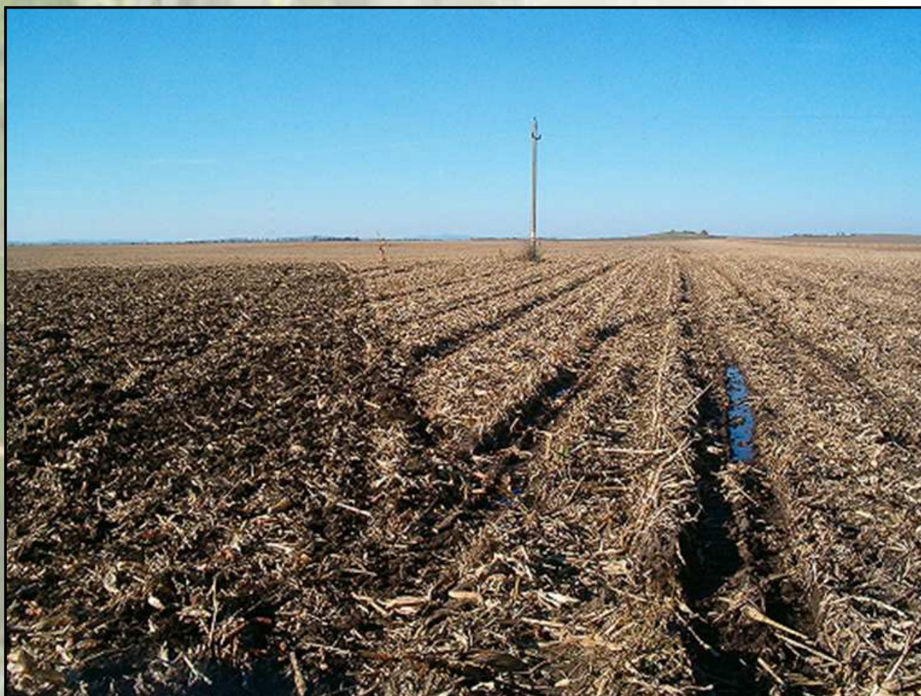
Duolent DX 460 NS - JD 8300 traktorral 18-22 cm művelési mélység, 11,5 t termésátlag (Balatonszabadi, Siófoki Siómente Zrt.)

Korábban két kapasorral rendelkező szántóföldi kultivátorral (Farmet G sorozat) nem végeztünk arra irányuló kísérleteket, hogy ezek a gépek a kukorica tarló hántására mennyiben alkalmasak. A kapákkal rendelkező nehézkultivátorok nagy része alkalmatlan a kukorica tarlók hántására, mivel a nagy mennyiségű szármaradványt összehúzzák. Az idei évben számos partnergazdaságunkban bemutatkoztak a szintén két kapasorral rendelkező Duolent kultivátorok, amelyek a rendkívül nagy mennyiségű zöld tömeget és szármaradványt is jól kezelték. Adódott a kérdés, hogy ezek a gépek alkalmasak lehetnek-e a kukorica tarlópántására is, vagy sem - reális alternatívát jelentve a nagy tárcsalap átmérővel rendelkező rövid tárcsák, vagy nehéztárcsák mellett. Több Somogy megyei partnergazdaságunk nyitottnak mutatkozott a Duolent kukorica tarlóban történő kipróbálására, így az ott szerzett tapasztalatokról számolunk be röviden, illetve közléseink néhány a próbák során készült képet. Honlapunkon ( www.eurofarm.hu ), a Hírek menüpontban "Kukorica tarlón is bizonyít a Duolent nehézkultivátor" című cikkünk mellékleteként kisfilmet is megnézhetnek a gépek munkájáról.