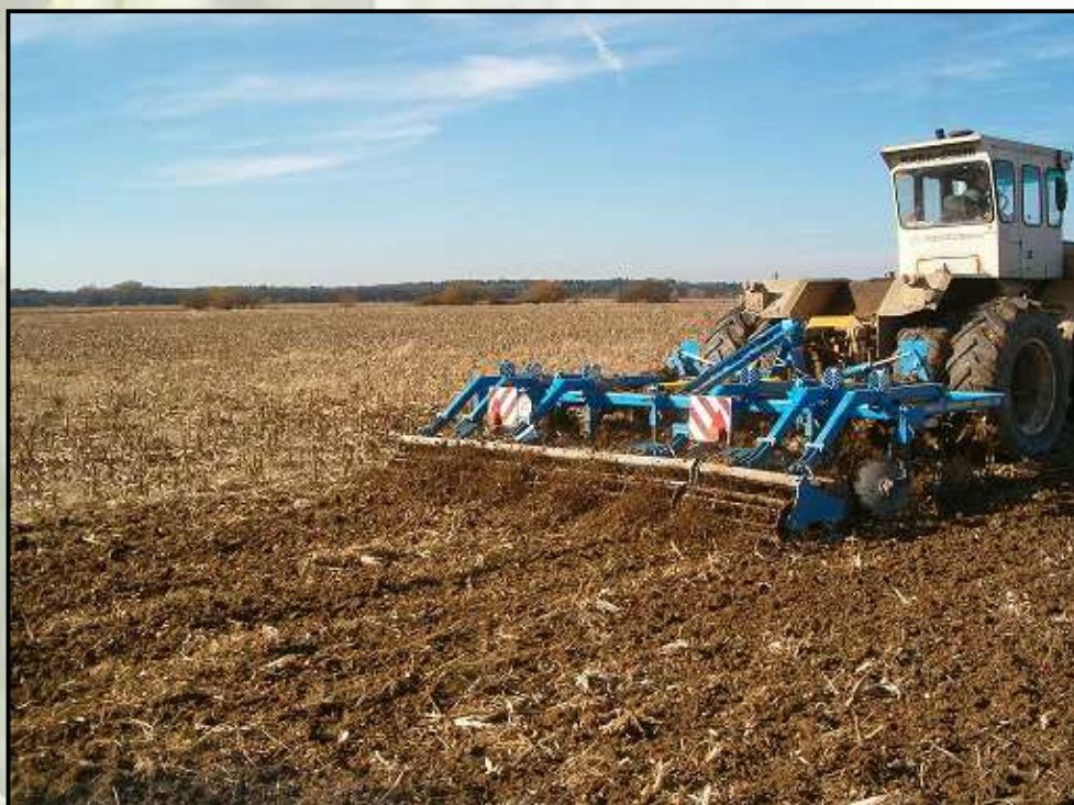
Duolent DX 460 NS - Rába Steiger 250, 15 cm művelési mélység