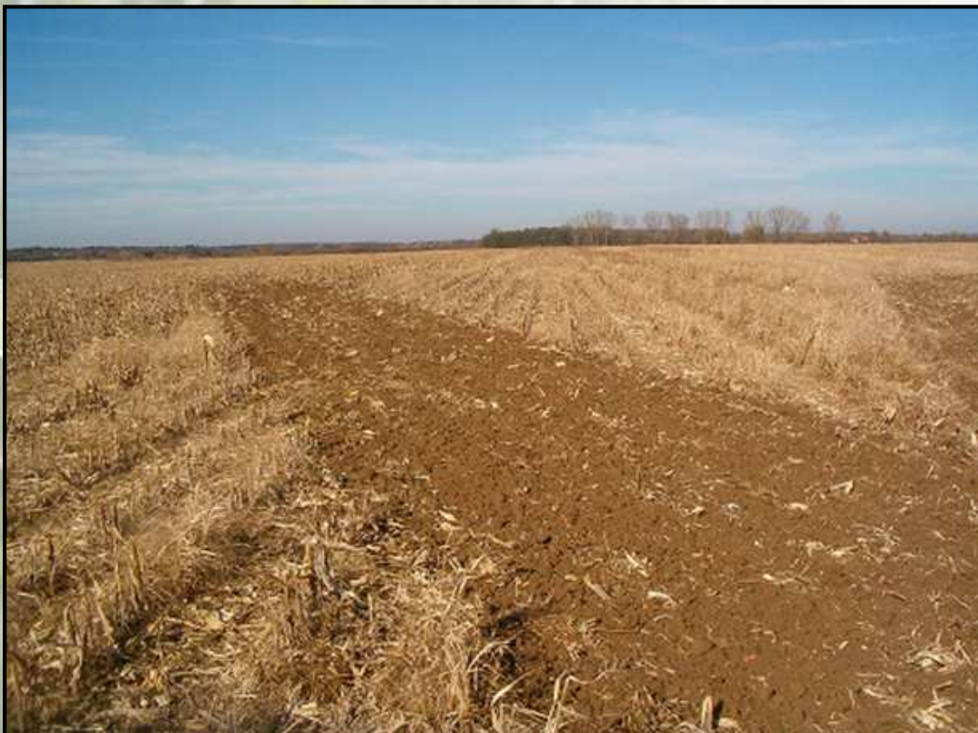
Duolent DX 460 NS - Rába Steiger 250, 15 cm művelési mélység (Nagybjajomi Mg. Zrt., Nagybjajom)

A Nagybjajomi Mg. Zrt. területén, Nagybjajomban egy RÁBA Steiger traktorral üzemeltettük a Duolent DX 460-at. A gép a szecsázott kukorica tarlóban kiváló munkát végzett. Az eredmény: kedvező rögfrakció, morzsás talajszerkezet, a szármaradványok döntő többsége bekeverve a talajba, egyenletes felszín, nagy területteljesítmény.