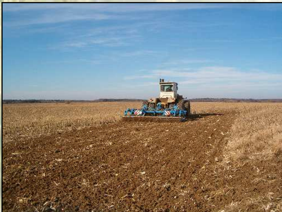
Duolent DX 460 NS - Rába Steiger 250, 15 cm művelési mélység