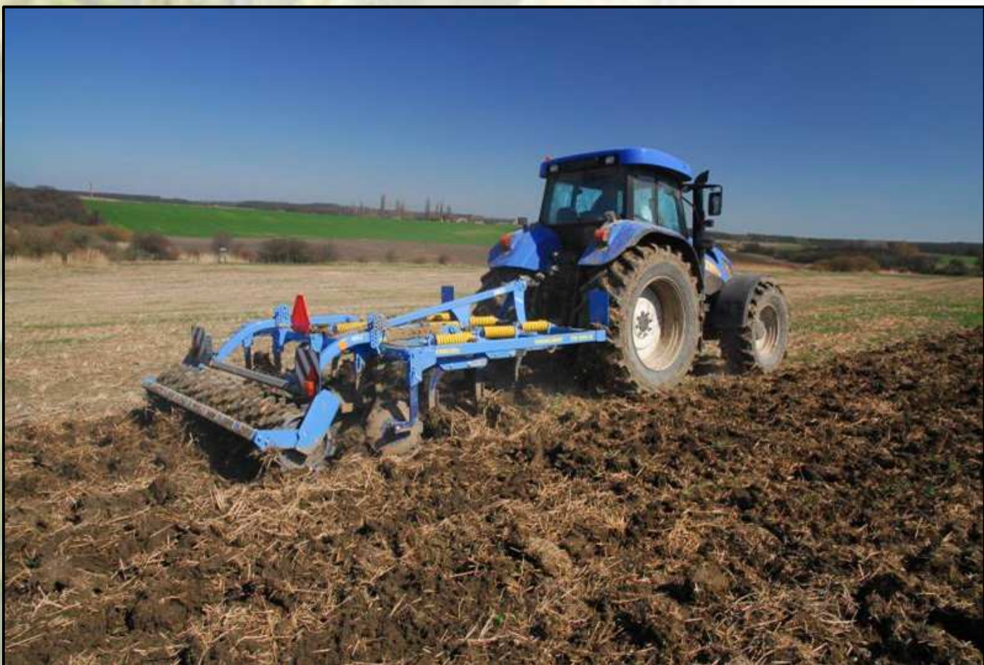
Triolent TX 300 szegmentált hengerrel

Amennyiben korábban megvásárolt nehéz kultivátorhoz a fentiekben ismertetett hengerek közül valamelyik beszerzése esedékes lehet, kérem, keressék kollégáinkat a lenti elérhetőségeken! (Kérjük megadni a gép típusát és alvázszámát is!)