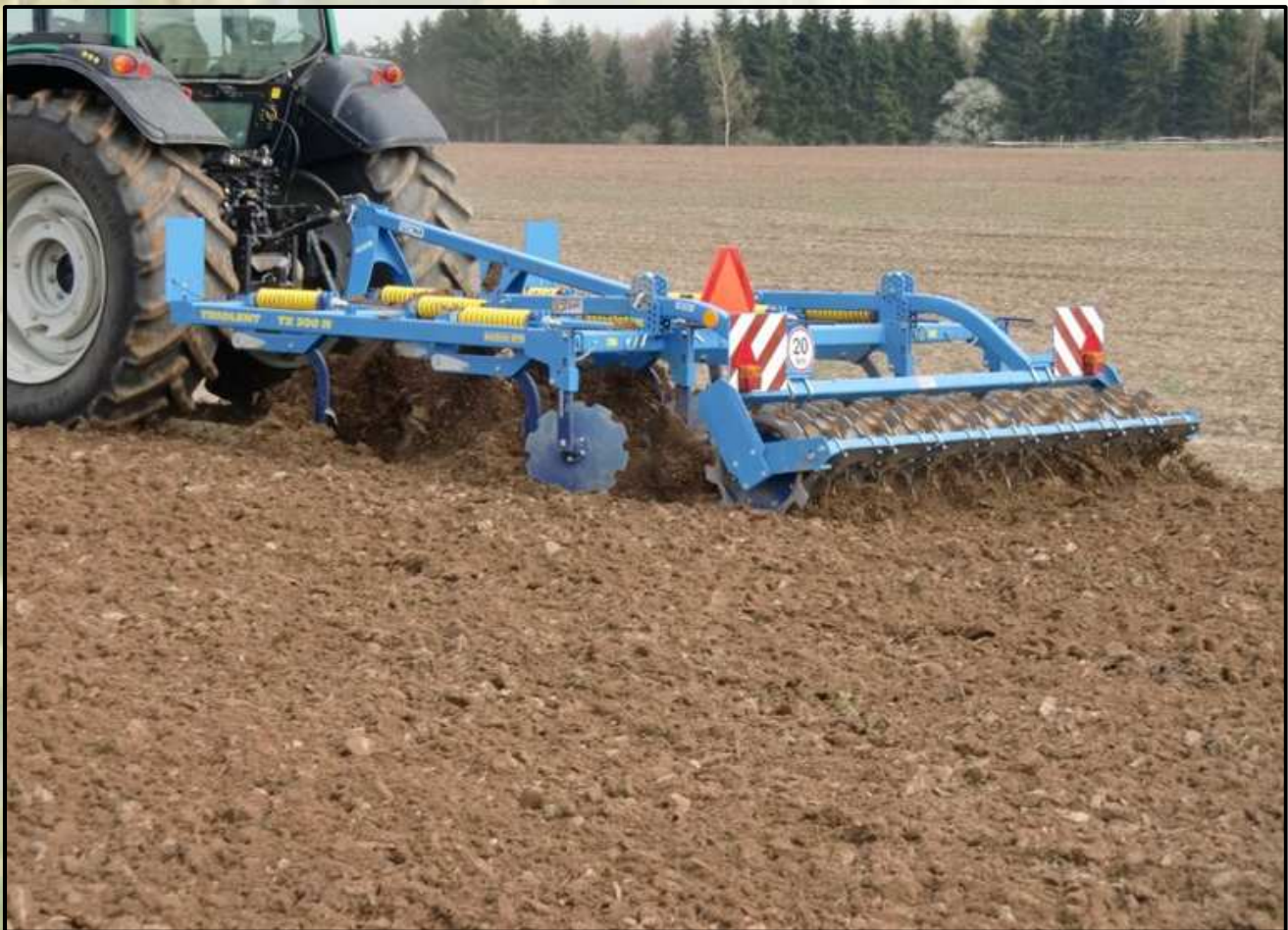
Triolent TX 300 szegmentált hengerrel

A TRIOLENT kultivátort az üzemeltetési körülmények figyelembe vételével 6 féle lezáró hengerrel szerelhetjük fel, amelyek a következők: