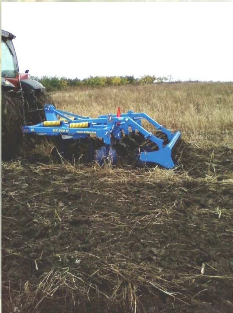
2. ábra: 26 cm munkamélység, agyagos vályog, eső után

Tesztünk szintén napraforgó tarlón történt, ami az előbbi példával ellentétben háttatlan és felgyomosodott felülettel várta a kultivátort. Szakmailag nem lett volna szabad azon a napon dolgozni a Duolenttel, mivel az agyagos vályog talaj feszínét az előző napon esett eső csúszóssá tette. Mi azonban arra voltunk kíváncsiak, hogy hol a határ a kultivátor képességeinél. Megállapíthattuk, hogy a felszínen heverő átázott szármagvány, a lábon álló megerősödött gyomok, nem toltak össze sem a késszáraknál, sem az egyengető tárcsáknál. A túláztott földdel még így is elfogadható mulchot alkottak. (2. ábra)