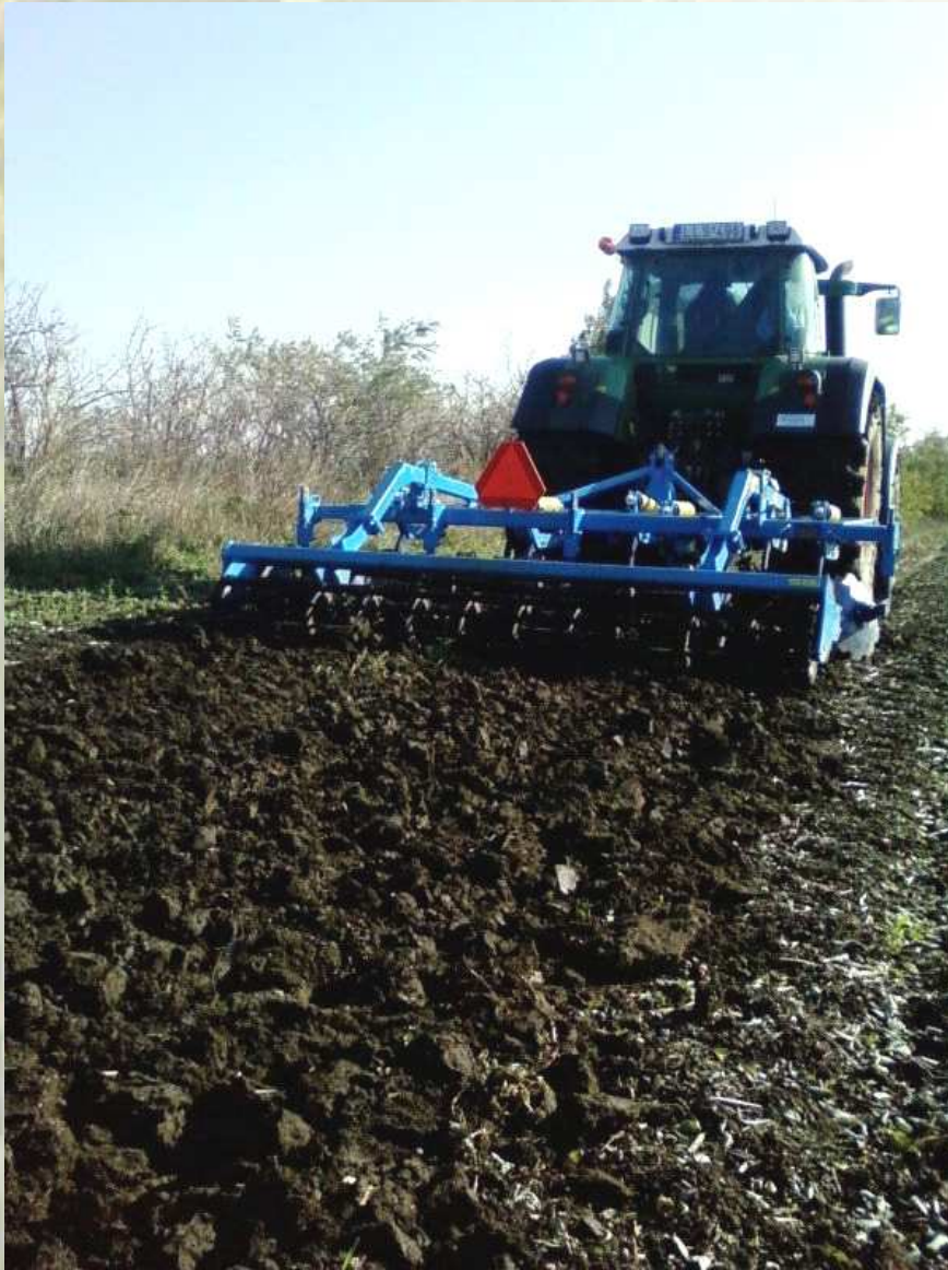
3. ábra: Táblaszéli út feltörése

Természetesen a kipróbálásra normal talajviszonyok között is sor került sok-sok hektáron. Összegezve megállapíthatjuk, hogy a ránézésre egyszerű, kompakt felépítésű gép meglepő immunitást tanúsít a kedvezőtlen talajviszonyokkal, szármaradványokkal szemben.