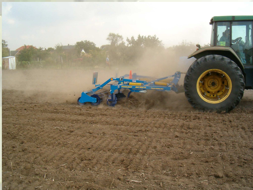
1. ábra: 28 cm munkamélység napraforgó tarlóban

Az első műveleteket egy tarlókántott napraforgó táblán végezte a gép. A rendkívüli szárazság ellenére a kések magabiztosan húzták be a kiválasztott mélységbe a művelőelemeket. A száraz talajt a gép intenzíven lazította és keverte, az ilyenkor általában tapasztalható erős rögzépződés nélkül. A talajfelszínen itt-ott előbukkanó öklömnyi hant sejtette, hogy micsoda szárazság uralkodhat a munkamélységben. Nyilván ennek a korrekt műveleti képességnek az extrém száraz körülmények között nemcsak a gép kiválósága, hanem a talaj szakszerű agrotechnikai előlétele és az időben elvégzett tarlókántás is a záloga volt. (1. ábra)