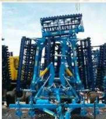
K 930 PS