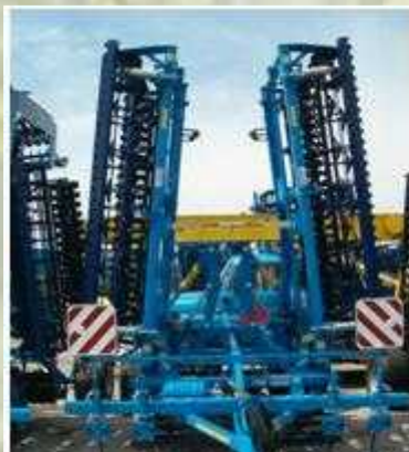
K 800 PS

A különböző erőgépekhez igen kiterjedt munkaszélesség tartomány áll a gazdálkodók rendelkezésére. 2,5 m-es munkaszélességtől kezdve egészen 15,7 m-ig van lehetőség a méretben a traktorhoz legjobban illeszkedő kompaktor kiválasztására. Függesztett kivitelben 3 modell (2,5; 3; 4 m-es), féligfüggesztett kivitelben 11 modell (3; 4; 4,5; 5; 6; 7; 8; 9,3; 10; 12,5; 15,7 m) közül választhatunk.