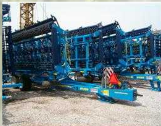
K 1250 PS

A 12,5 m-es és 15,7 m-es kompaktorok esetében egy tandem tengelyes szállító alváz került kialakításra, aminek következtében a gépek rendkívül kompakt szállítási méretekkel rendelkeznek, illetve jó a manőverező képességük. Még a 15,7 m-es gép sem szélesebb 3 m (!)-nél és nem magasabb 3,5 m (!)-nél. A hossz 9,3 m. A magas 10-12 km/h-s munkasebesség nagy hatékonyságot biztosít ezen eszközöknek. A 15,7 m-es munkaszélességű géppel elérhető akár a 19 ha/h területteljesítmény is. A viszonylag alacsony tömegnek is köszönhetően a gázolaj fogyasztás 5-6 l/ha körül mozog.