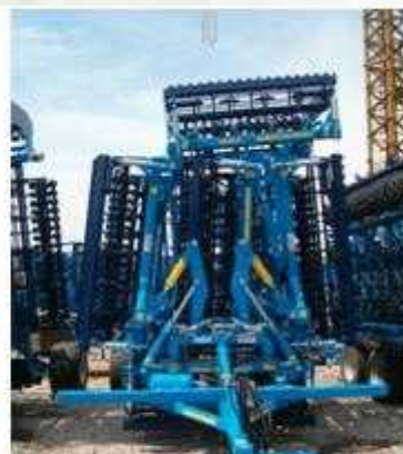
K 1000 PS

A 12,5 m-es és 15,7 m-es kompaktorok esetében egy tandem tengelyes szállító alváz került kialakításra, aminek következtében a gépek rendkívül kompakt szállítási méretekkel rendelkeznek, illetve jó a manőverező képességük. Még a 15,7 m-es gép sem szélesebb 3 m (!)-nél és nem magasabb 3,5 m (!)-nél. A hossz 9,3 m. A magas 10-12 km/h-s munkasebesség nagy hatékonyságot biztosít ezen eszközöknek. A 15,7 m-es munkaszélességű géppel elérhető akár a 19 ha/h területteljesítmény is. A viszonylag alacsony tömegnek is köszönhetően a gázolaj fogyasztás 5-6 l/ha körül mozog.