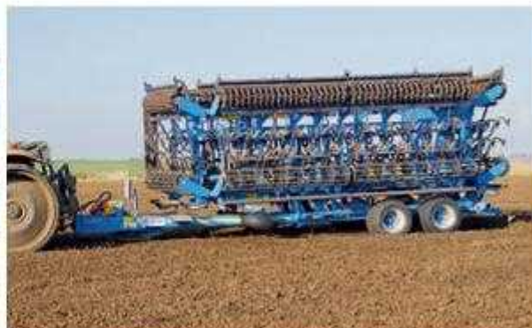
K 1570 PS