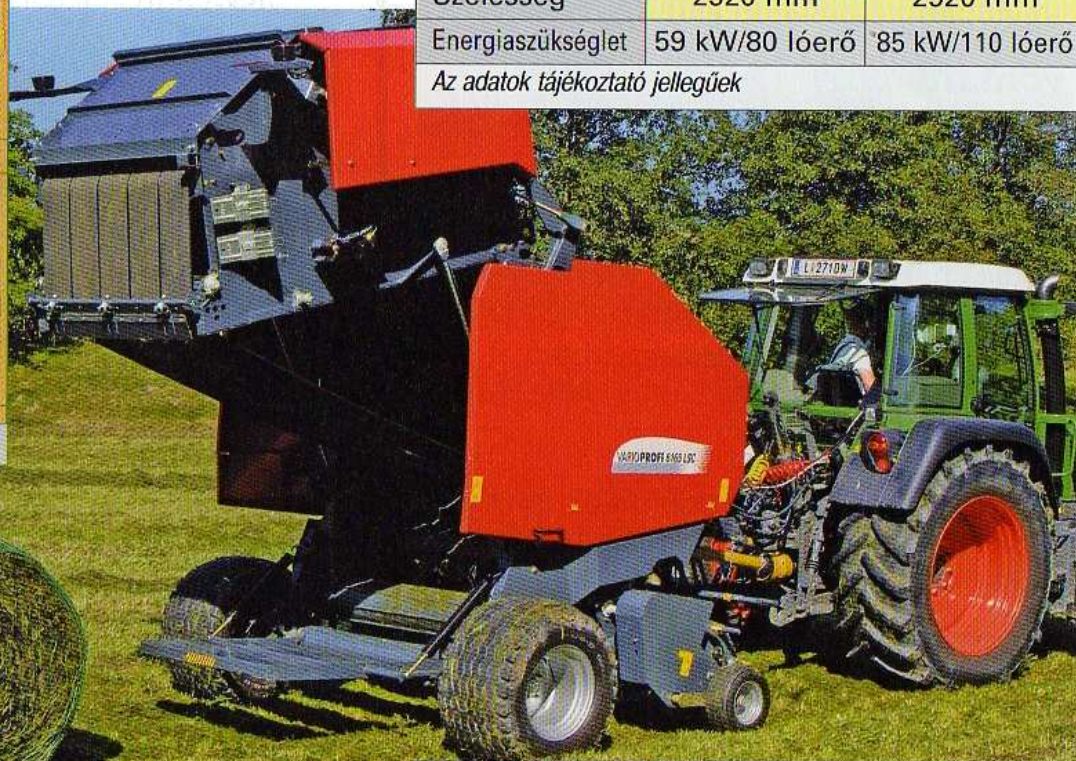
VARIOPROFI 6165 L SC